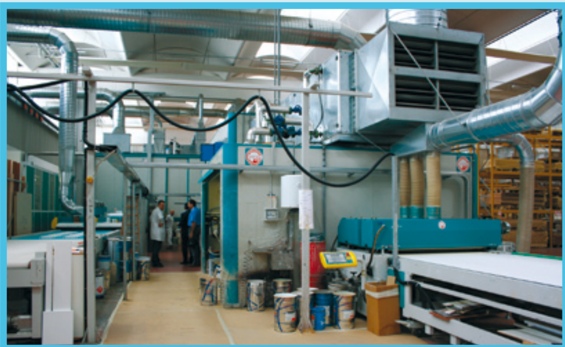
4 - The coating line.