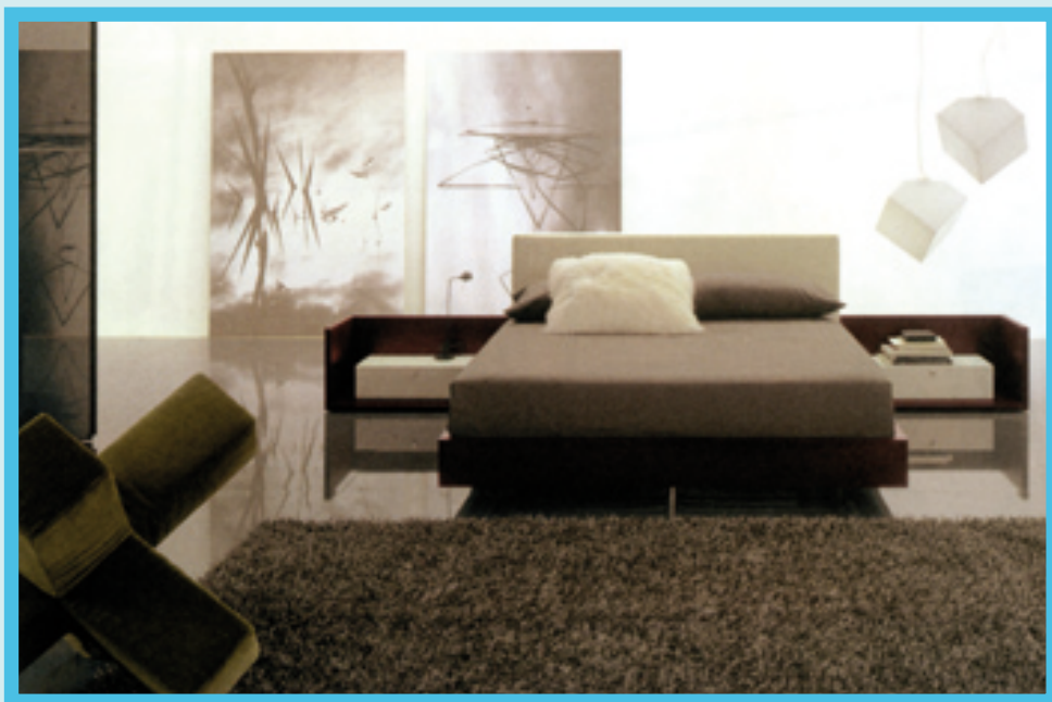
3 - A model bedroom.

Per il suo catalogo mette a disposizione 40 colori standard, oltre a quelli specifici richiesti dai clienti. Impiega truciolare ricoperto con carte melamminiche stuccate, levigate e finite con i prodotti all'acqua prima ricordati. Serve il mercato nazionale, ed esporta in Europa e Cina.